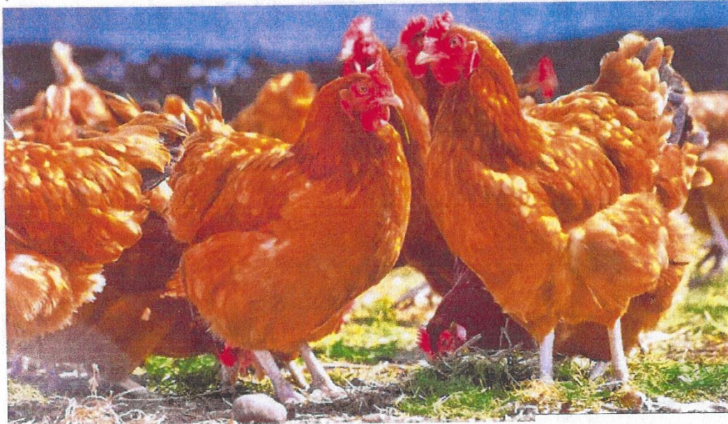
LDC a lancé l'élevage de volailles en plein air en Pologne.

LDC (volailles de Loué), leader en France, se renforce en Pologne. C'est le pays le plus gros producteur de poulets et de dindes en Europe. Le groupe sarthois est sur le point d'acquérir Indykpol, le premier producteur de dindes en Pologne.